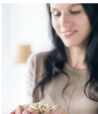
Umwelt- und preisbewusst heizen

Weitere Details zur Förderung sind erhältlich unter: www.holzheizungen.klimafonds.gv.at