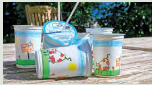
Schulmilch: schmeckt und ist gesund.